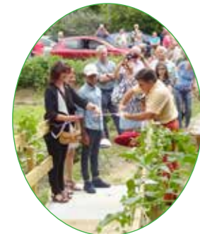
9 juillet : inauguration du Chemin des Eco-liers et du petit pont sur la Manse à l'occasion du cinquantième de la fermeture de l'école de la vallée de Courtineau.