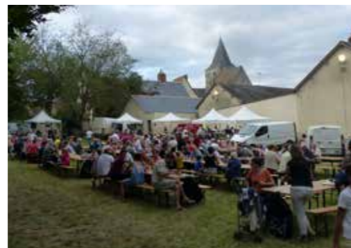
29 juillet : marché nocturne