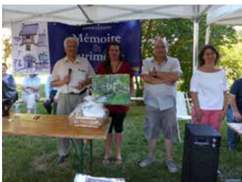
17 juillet : remise des prix lors de la Journée du Chevalet