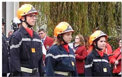
Après la remise de leurs insignes lors de la Saint-Barbe le 11 novembre 2018.

cross organisés dans l'année dans le département. Ce 2 décembre, sous un crachin tenace, ce sont plus de 350 JSP et pompiers d'Indre-et-Loire qui se sont élancés dans les bois de Boizé, sur un parcours de 2000 m pour la catégorie benjamins à 10 000 m pour les seniors.